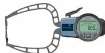
CMT 116 D