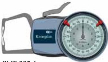
CMT 035 A