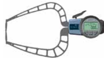
CMT 167 D