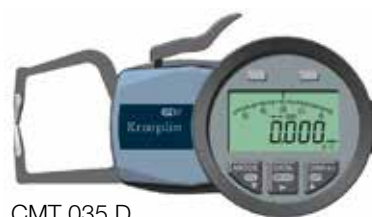
CMT 035 D