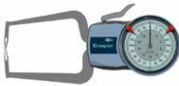
CMT 085 A